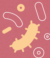
Sistema inmunitario debilitado tras otras enfermedades